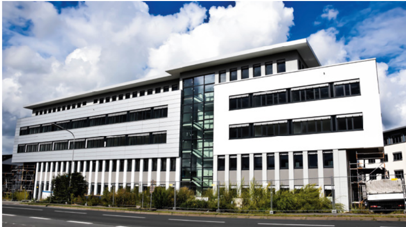
Außenfassade unter Dach und Fach: Neubau der Haftpflichtkasse am Firmensitz in Roßdorf